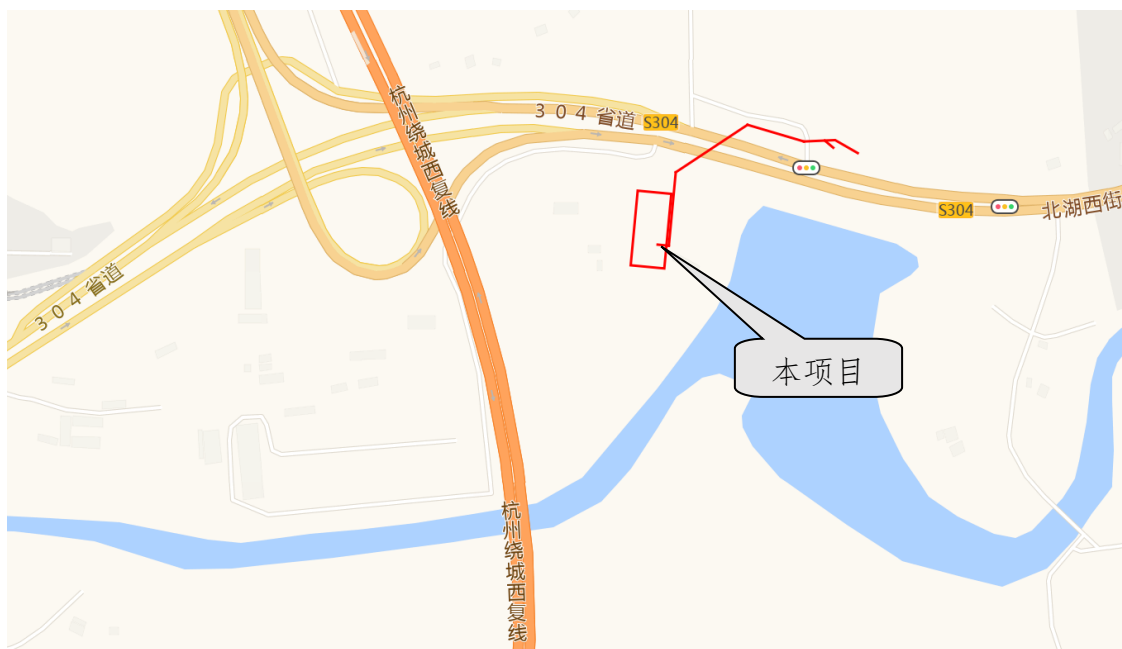
图 1-1 项目地理位置示意图