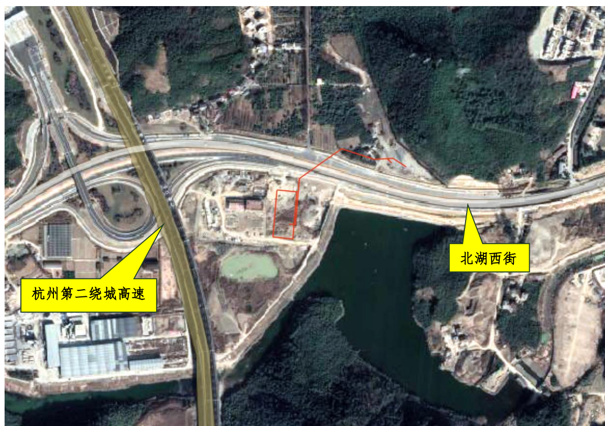
图 1-4 沿线地貌卫星图