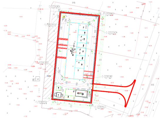
图 1-2 三桥变电站址现状