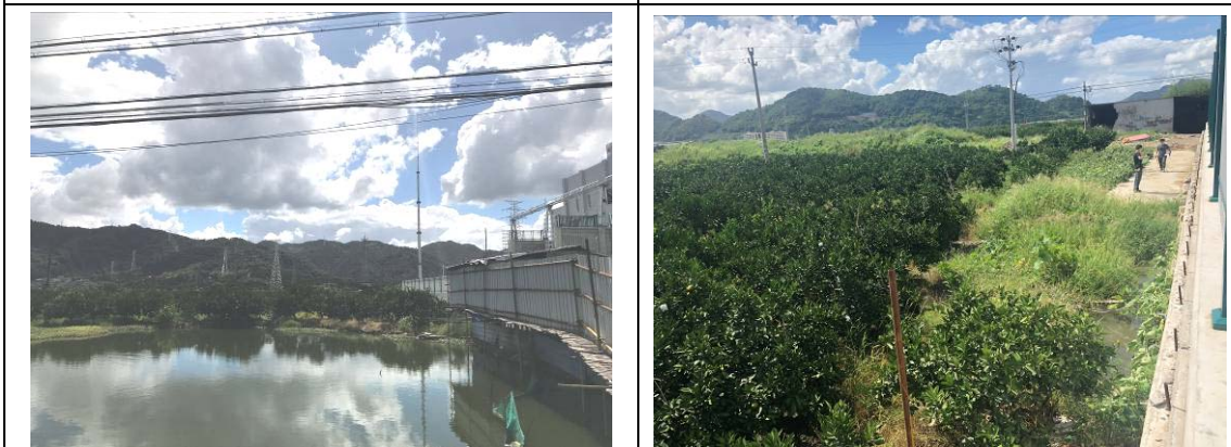
站区南侧生态现状