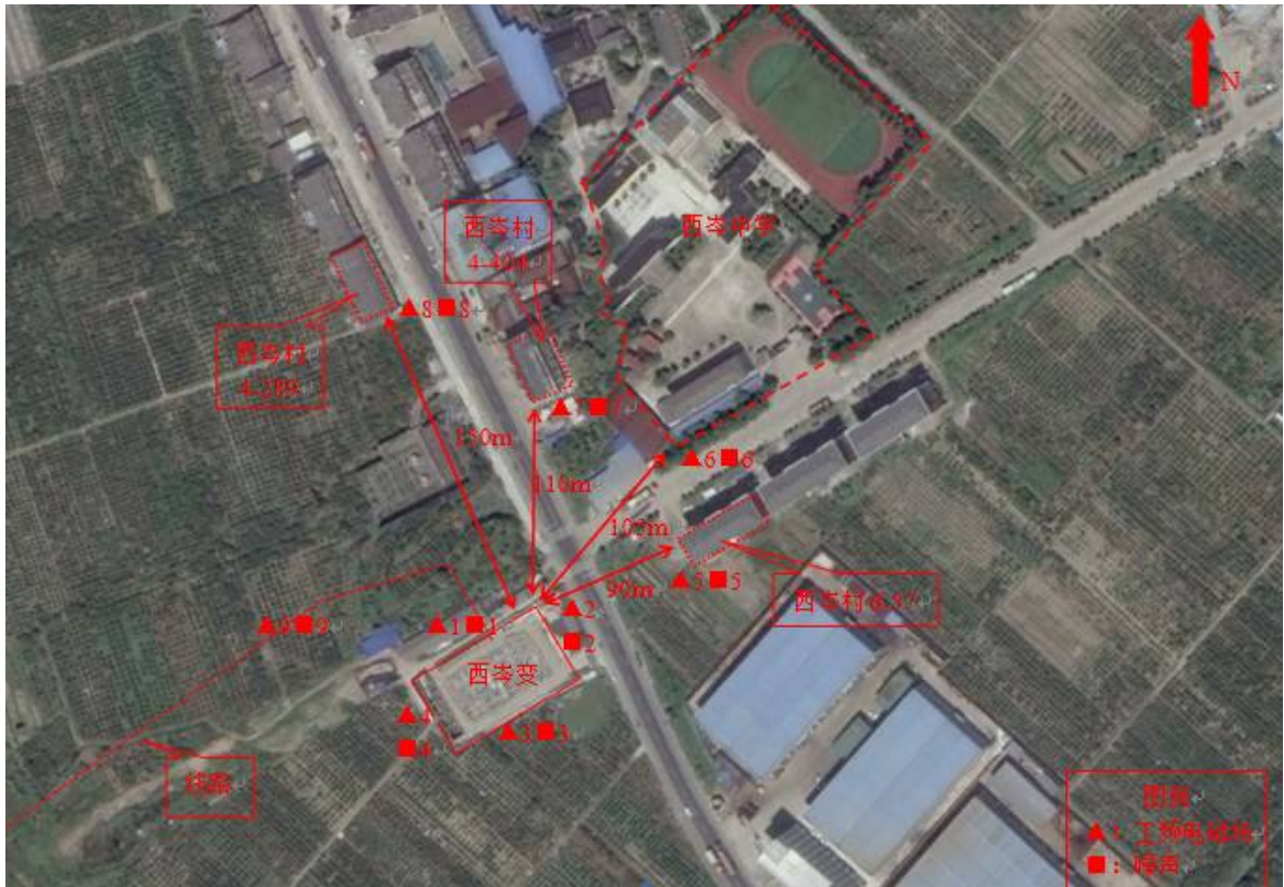
图 7-1 监测点位示意图